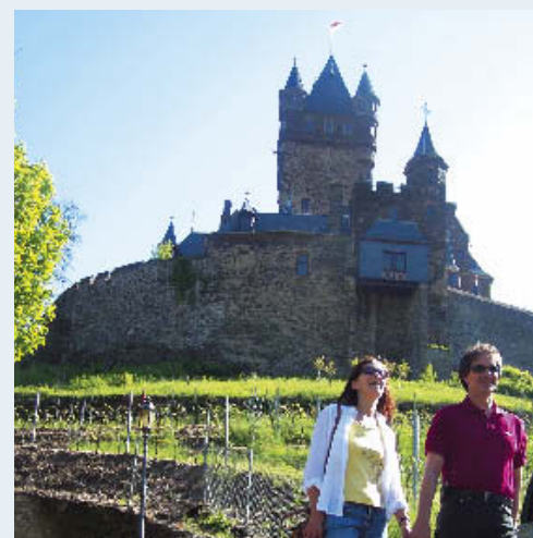
Alle Angaben ohne Gewähr! Änderungen vorbehalten.