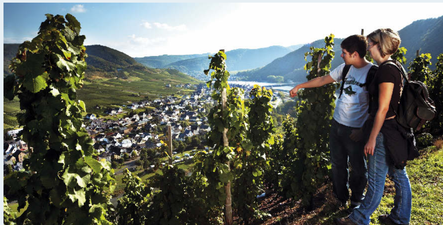
digit/Verlag · Bruttig-Fankel 14_07